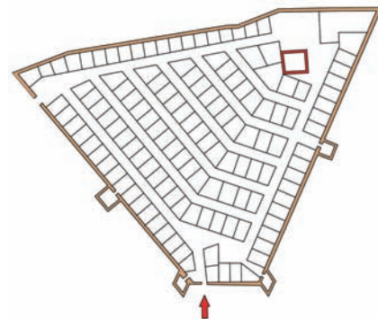
Distribució hipotètica de les cases i els carrers al segle XVI. Distribución hipotética de las casas y las calles en el siglo XVI.

L'any 1983 passà a ser de propietat municipal.