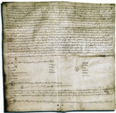
Tractat de Capdepera. Conservat a la Biblioteca Nacional de París. Tratado de Capdepera. Conservado en la Biblioteca Nacional de París.

L'any 1300 el rei Jaume II, per garantir el control de la zona i les comunicacions marítimes amb Menorca, va ordenar la fundació de Capdepera, una vila emmurallada vora aquella torre, amb l'objectiu de reunir-hi la població que aleshores vivia dispersa pel territori. Així, l'anomenat Castell de Capdepera és, en realitat, un poble fortificat.