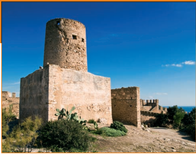
Torre de Nunis, de planta quadrada amb el molí circular construït a dins. Torre de Nunis, de planta cuadrada con el molino circular construido en su interior.

El Castell de Capdepera se situa al nord-est de l'illa de Mallorca, en un indret estratègic des del qual es divisen les terres de l'interior, part de la línia de costa i el canal de Menorca, que separa les dues illes.