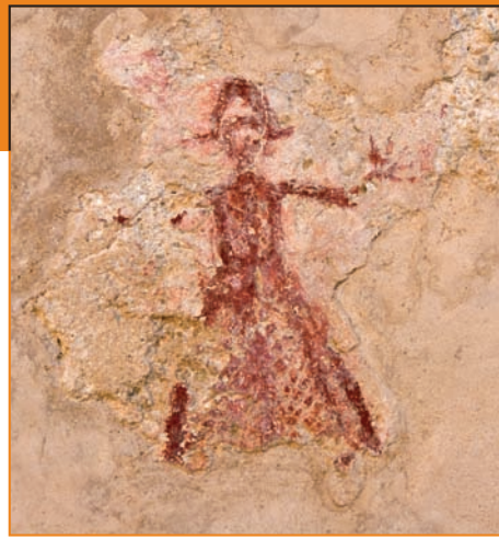
Pintura mural a la casa de la senyora. Pintura mural en la casa de la señora.

El sistema de vigilància del castell estava reforçat per les talaies edificades al llarg de la costa, amb la missió de controlar la mar.